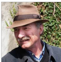
Oswald Burger Lesungen, Wanderungen, Spaziergänge