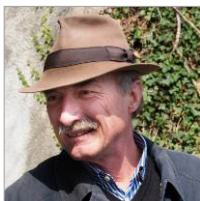
Oswald Burger Lesungen, Wanderungen, Spaziergänge